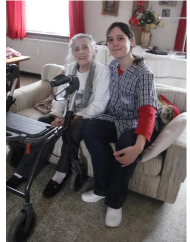
▲ケアサービスを利用される高齢者宅へ。介護スタッフとともに同行訪問し、24時間のホームケアの実際を見学。

○ほとんどの利用者が自己実現や生きがいの為に通っていた。日本では入浴や充実した食事が利用目的だが、それはあまり重要視されておらず、至れり尽くせりといった感じでもない。あくまで利用者自身が主人公であり職員はそのサポート役であるということが感じられた。 (特別養護老人ホーム・施設長)