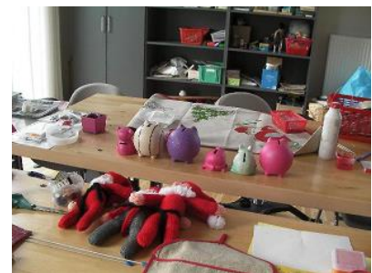
▲アクティビティセンターで利用者さんが作成された作品