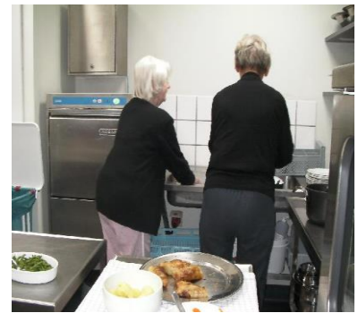
▲夕食後、食器の片付けをする入居者。進んで自分から洗いものをされており、順番や強制ではありません。研修では、高齢者住宅にて入居者と夕食をともにしてコミュニケーションをとれる機会があります。