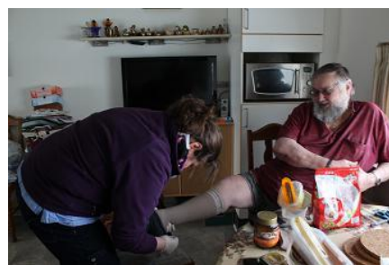
▲ヘルパーに同行して、実際の住宅での介護の様子を見学